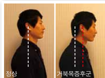
귓구멍에서 내린 선이 어깨선 보다 앞에 있으면 거북목증후군을 의심할 수 있다

정상적인 목과 어깨 자세는 옆에서 봤을 때 귓구멍에서 내린 선이 어깨선과 일치해야 합니다. 그것보다 앞에 위치한다면 거북목증후군을 의심할 수 있습니다.